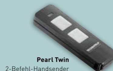
Pearl Twin 2-Befehl-Handsender

Enorm effizient: Energiesparend durch bis zu <1 Watt Verbrauch im Standby-Modus (modellabhängig)